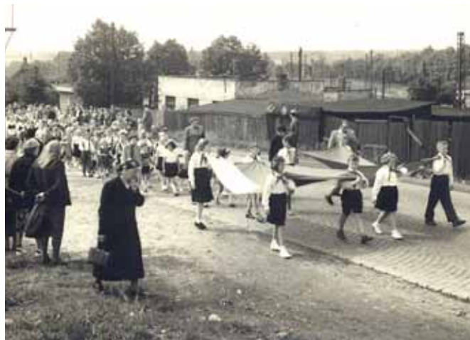
Jeden z řady poválečných průvodů obcí v letech 1946-1947