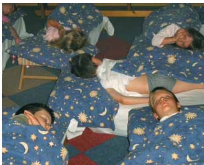
Již tradiční nocování ve školce