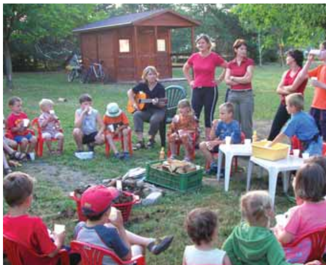
Slavnostní přípitek a písničky