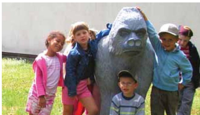
Sponzorský dar pro MŠ