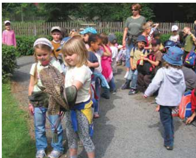
Výlet do Obory Žleby