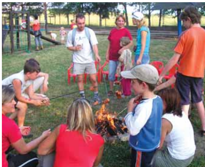
Buřty nesměly chybět