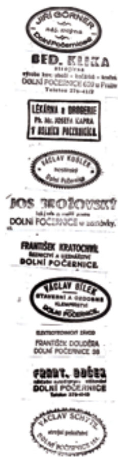
Razítka některých počernických obchodů a živností z let 1946 - 47