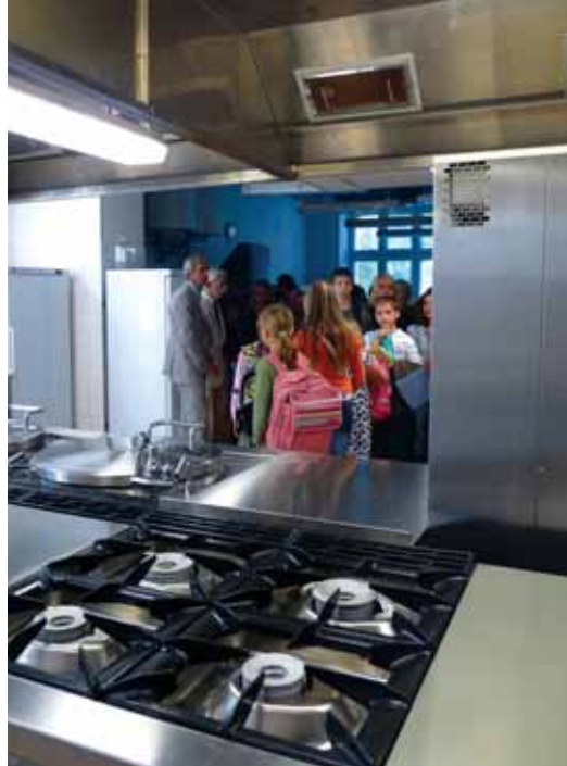
Nově vybavená kuchyně ZŠ

Největší investicí tohoto druhu je rekonstrukce drážního tělesa ČD Běchovice – Libeň. V naší MČ byl zrekonstruován podchod pod drážním tělesem, byla upravena i obě nástupiště včetně čekáren a byly vybudovány protihlukové stěny. Při úpravě podchodu došlo k technické závadě související s odvodněním