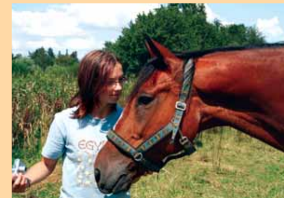
Pájo nelží, do té krabičky se přeci nemůžu vejít.