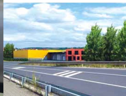
Vizualizace PNEU – Šafránek

Rovněž v ul. Národních hrdinů, u sjezdu na Štěrboholskou radiálou, provádí firma PNEU – Šafránek zemní práce pro vybudování svého nového pneuservisu.