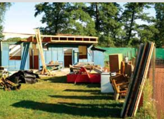
Rekonstrukce tenisových kurtů