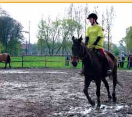
Jízdárna před rekonstrukcí...