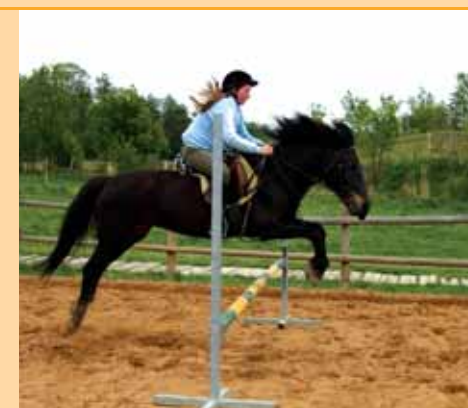
...a po rekonstrukci.